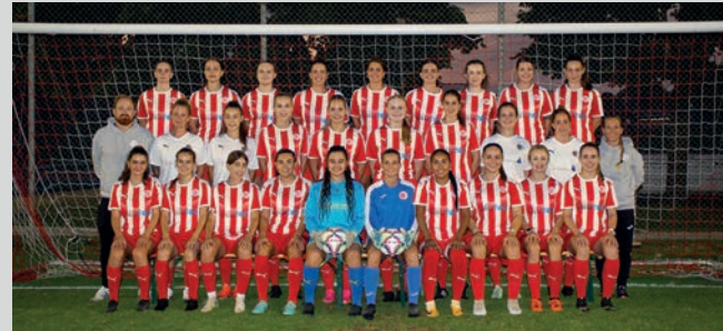
Frauenteam des FC Niederweningen