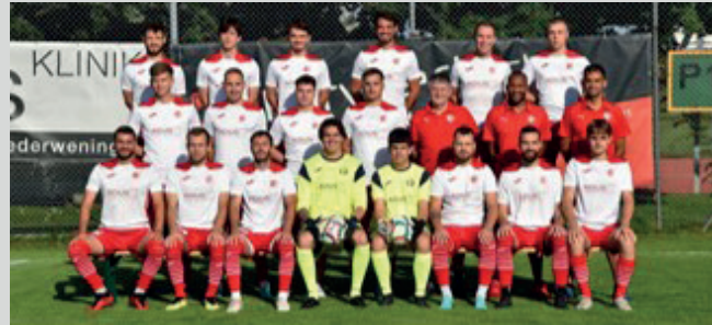
Die erste Mannschaft des FC Niederweningen