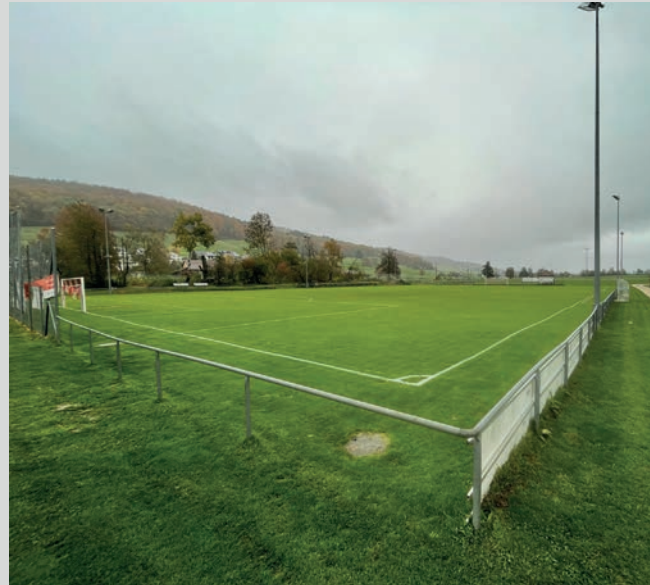
Platz 1: Hübvis