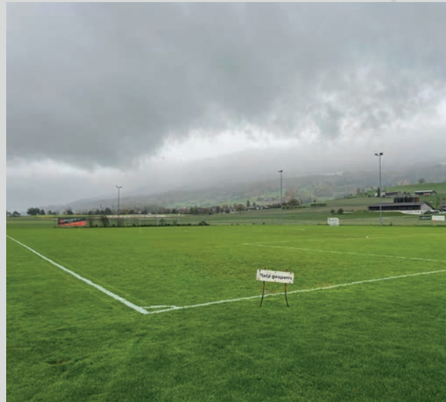
Platz 2: Huebwis