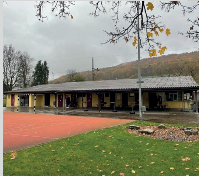
Garderoben und Clubhaus, Baujahr 1989